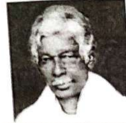
PANDIT RAGHUNATH MURMU (D. Litt in Santali, 5.5.1905 - 1.2.1982)